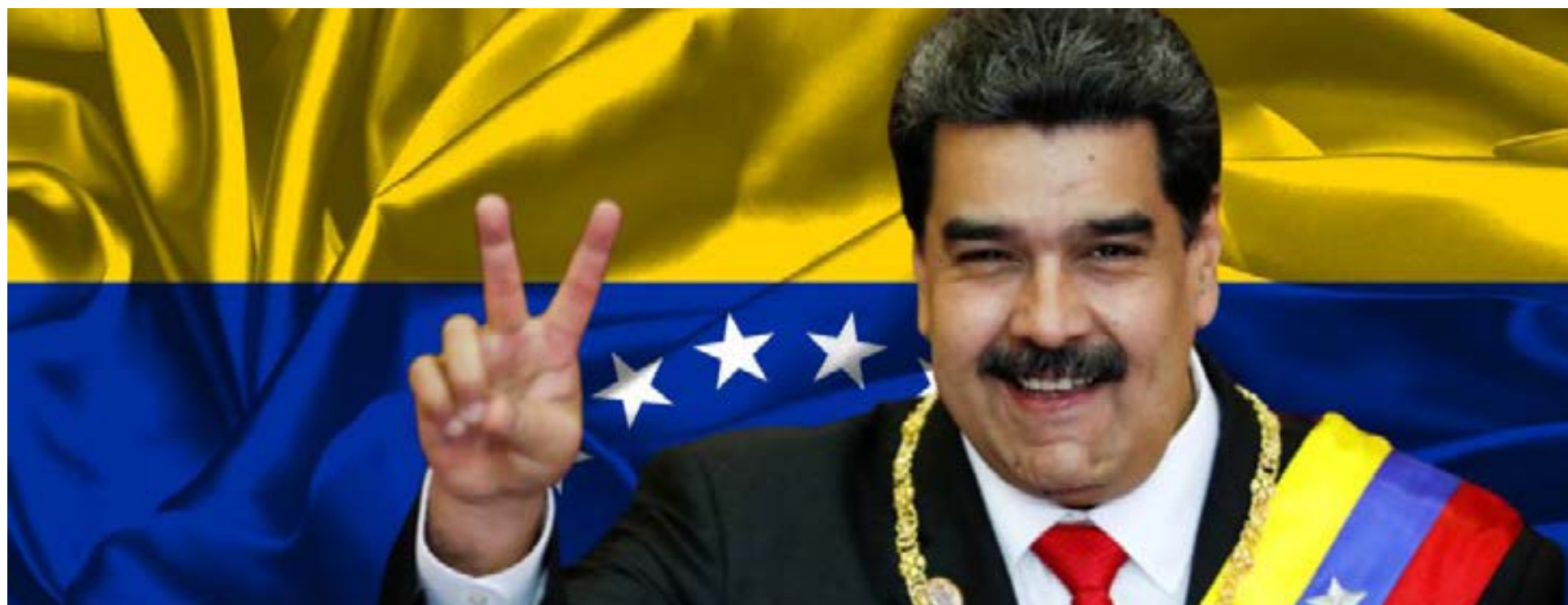
Nicolás Maduro Moros, presidente de la República Bolivariana de Venezuela.

¿Había se visto? Que un presidente gringo ofrezca 50 millones de dólares por quien atrape vivo o muerto al mandatario de un país vecino, es la tapa del congo.