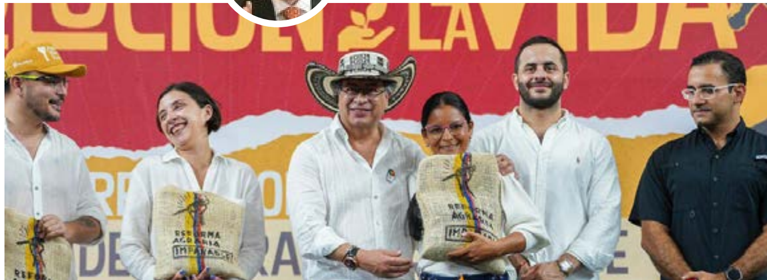
La entrega de tierras a campesinos hace parte de la Reforma Agraria que adelanta el presidente Petro.

G ustavo Petro ya está en campaña. No lo dice abiertamente porque sería admitir su ambición reeleccionista, pero cada vez que repite su nuevo eslogan, «hay que reelegir la reforma agraria», deja al descubierto su estrategia, convertir el campo en la excusa perfecta para quedarse en el poder. Lo hace con una fórmula que el populismo latinoamericano conoce de memoria, apelar a una causa noble, empaquetarla en un discurso emocional y usarla como coartada para justificar la continuidad.