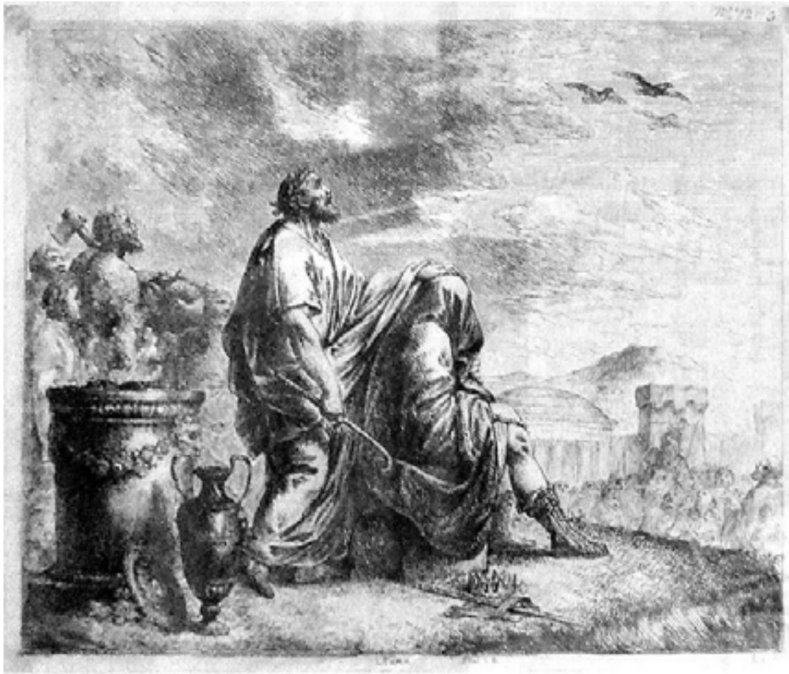
La adivinación y los adivinadores han estado presentes en la historia de la humanidad.

Eromancia, adivinación por medio de aire. Hidromancia: por medio del agua; Cafetomancia: por medio del café; Capno-