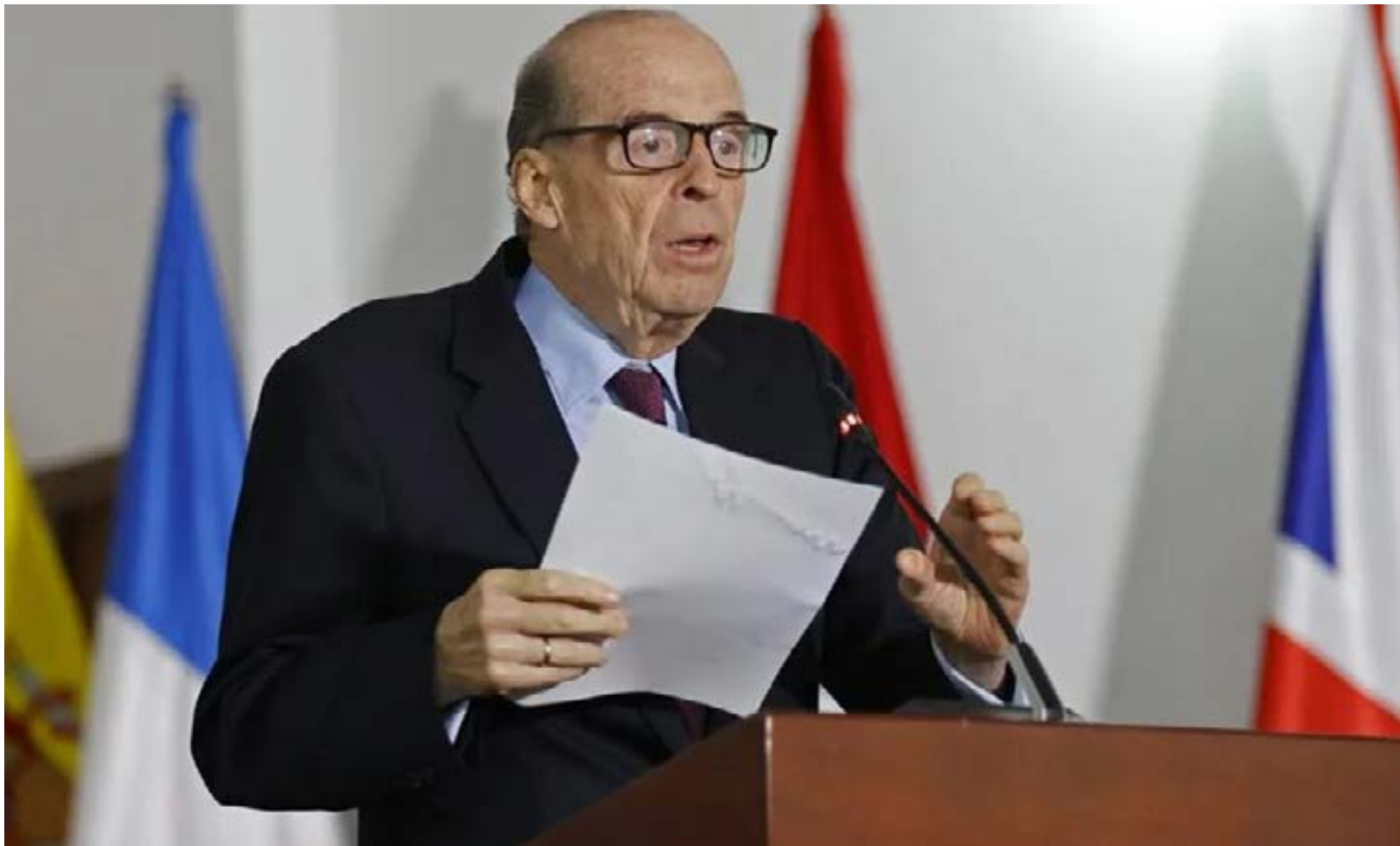
Álvaro Leyva a responder ante la justicia