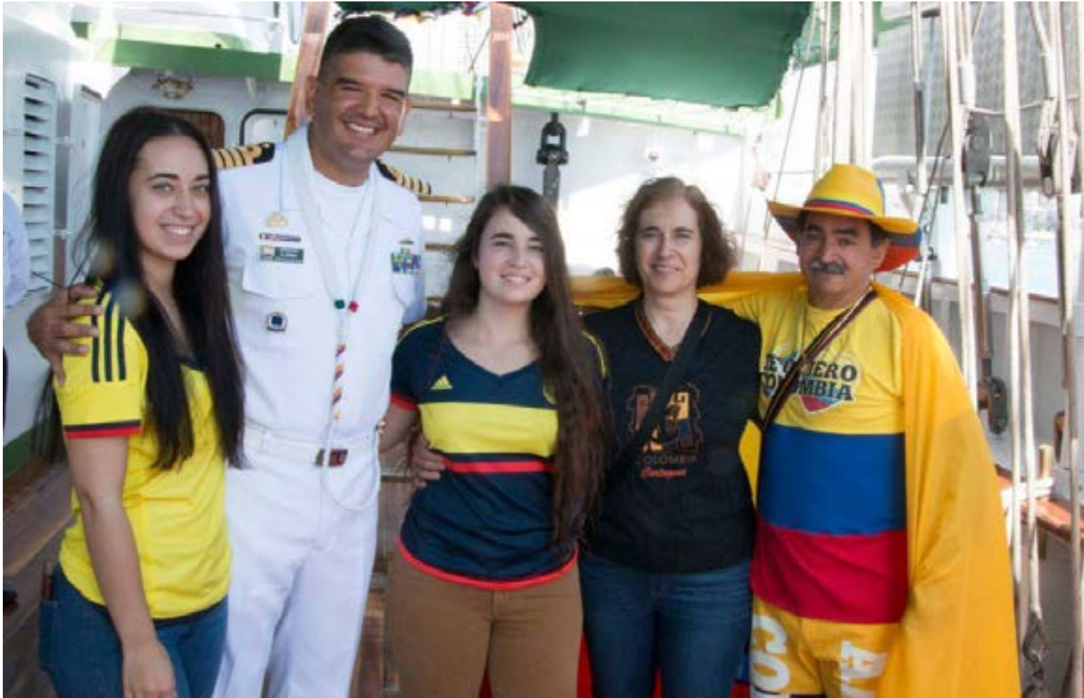
Los oficiales de la Marina saben quien es «Míster Colombia»

este país siempre he llevado puesto algo que me identifica de qué soy colombiano.