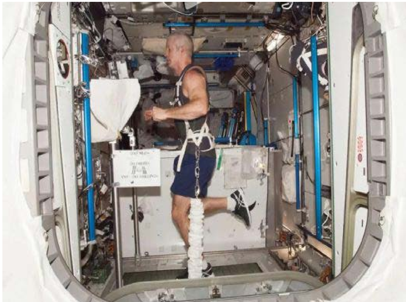
El astronauta de la NASA Steve Swanson se ejercita en la cinta de correr de resistencia externa con soporte de carga operacional combinada