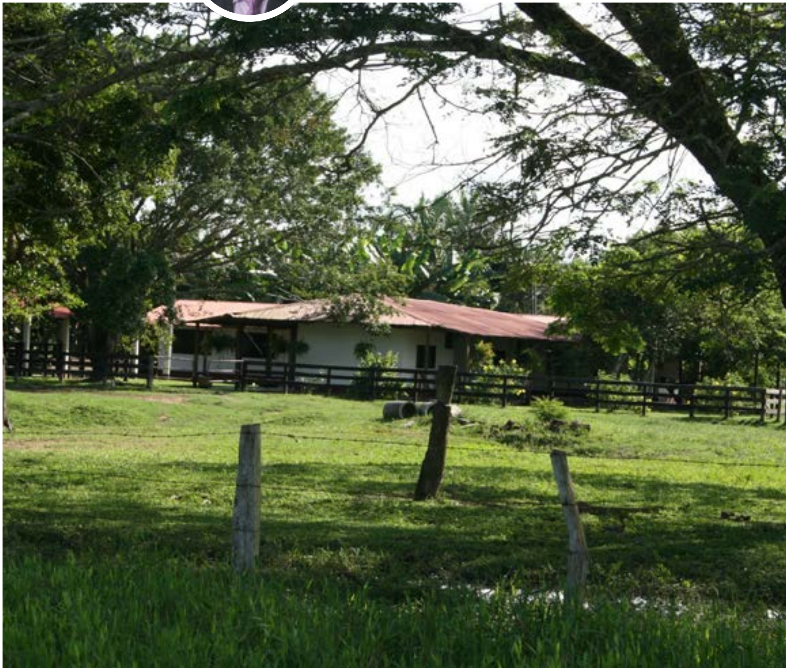
Trinidad, escenario de la Vorágine. Un patrimonio histórico