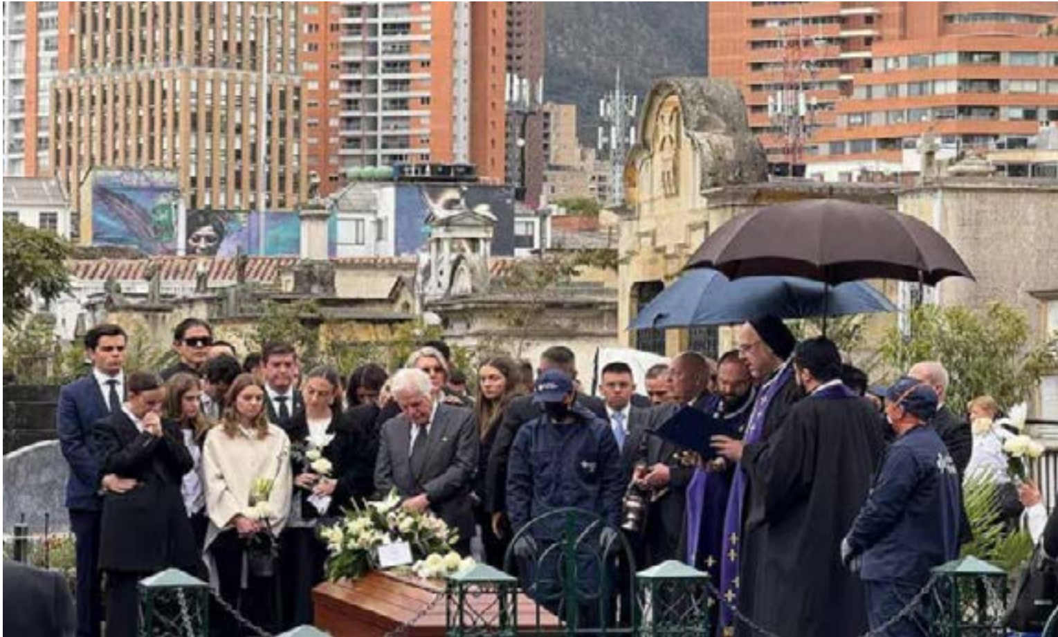
La sepultura del senador Miguel Uribe Turbay se llevó a cabo en el Cementerio Central de Bogotá, con una asistencia restringida a sus familiares y a un selecto grupo de allegados.

lez, quien no pudo asistir a los actos fúnebres de Miguel Uribe debido a su proceso judicial.